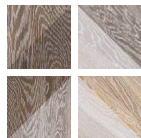
Taco GF-20305D Melange Natural 16,5x16,5 cm / 6,5"x6,5"