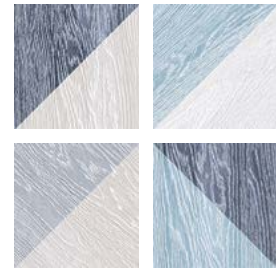
Taco GF-20305D Melange Blue 16,5x16,5 cm / 6,5"x6,5"

33,15x33,15 cm / 13,1"x13,1" 16,5x16,5 cm / 6,5"x6,5"