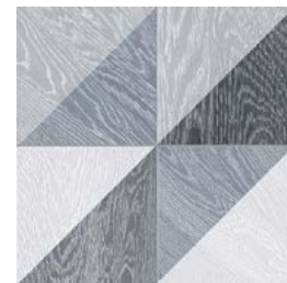
Melange Black GF-20300D 33,15x33,15 / 13,1"x13,1"