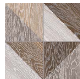
Melange Natural GF-20300D 33,15x33,15 / 13,1"x13,1"