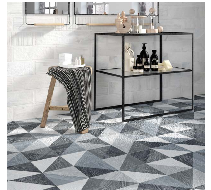
Taco Melange Black 16,5x16,5 / 6,5"x6,5" · Brick Brooklyn Blanco 11x33,1,5 / 4,3"x13,1"