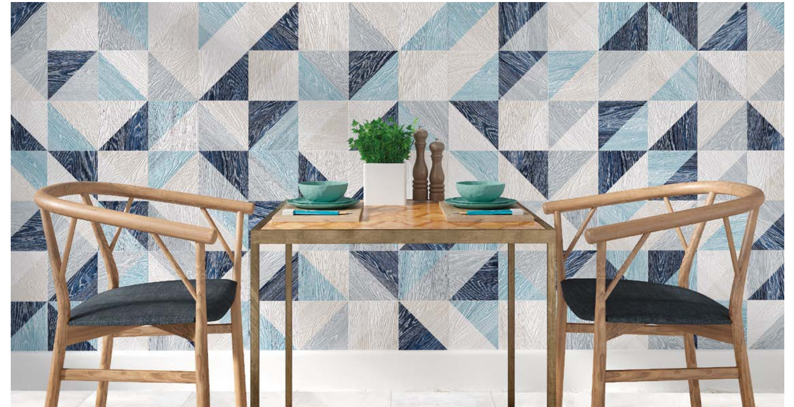
Taco Melange Blue 16,5x16,5 / 6,5"x6,5"