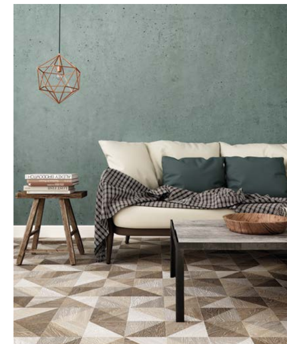
Taco Melange Natural 16,5x16,5 / 6,5"x6,5"