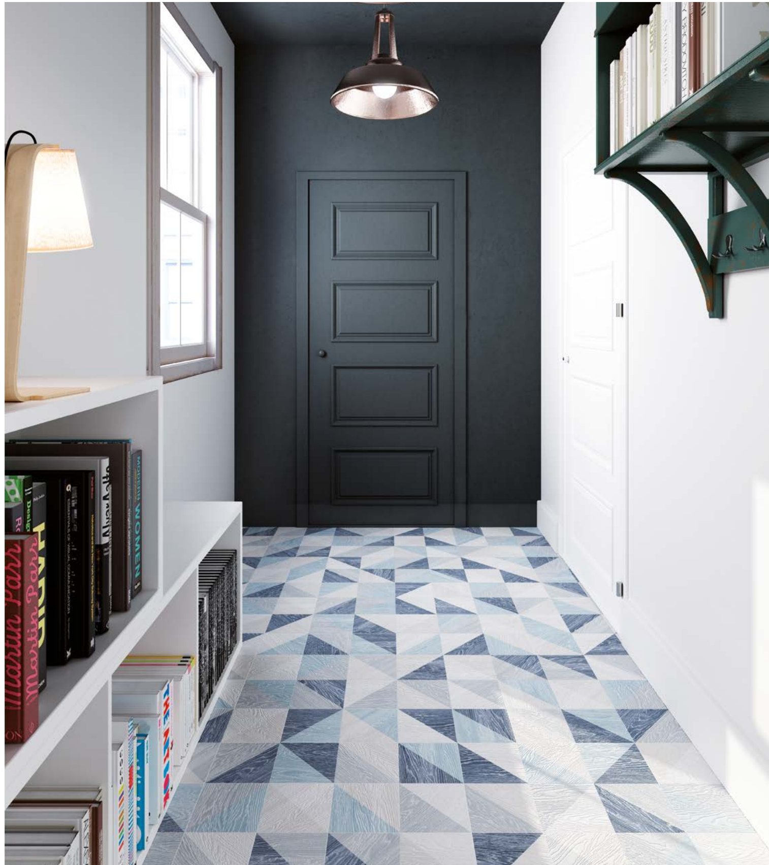
Taco Melange Blue 16,5x16,5 / 6,5"x6,5"

33,15x33,15 cm / 13,1"x13,1" 16,5x16,5 cm / 6,5"x6,5"