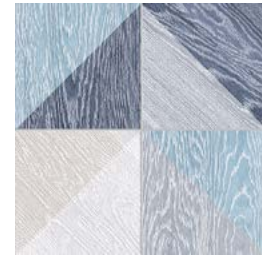
Melange Blue GF-20300D 33,15x33,15 / 13,1"x13,1"