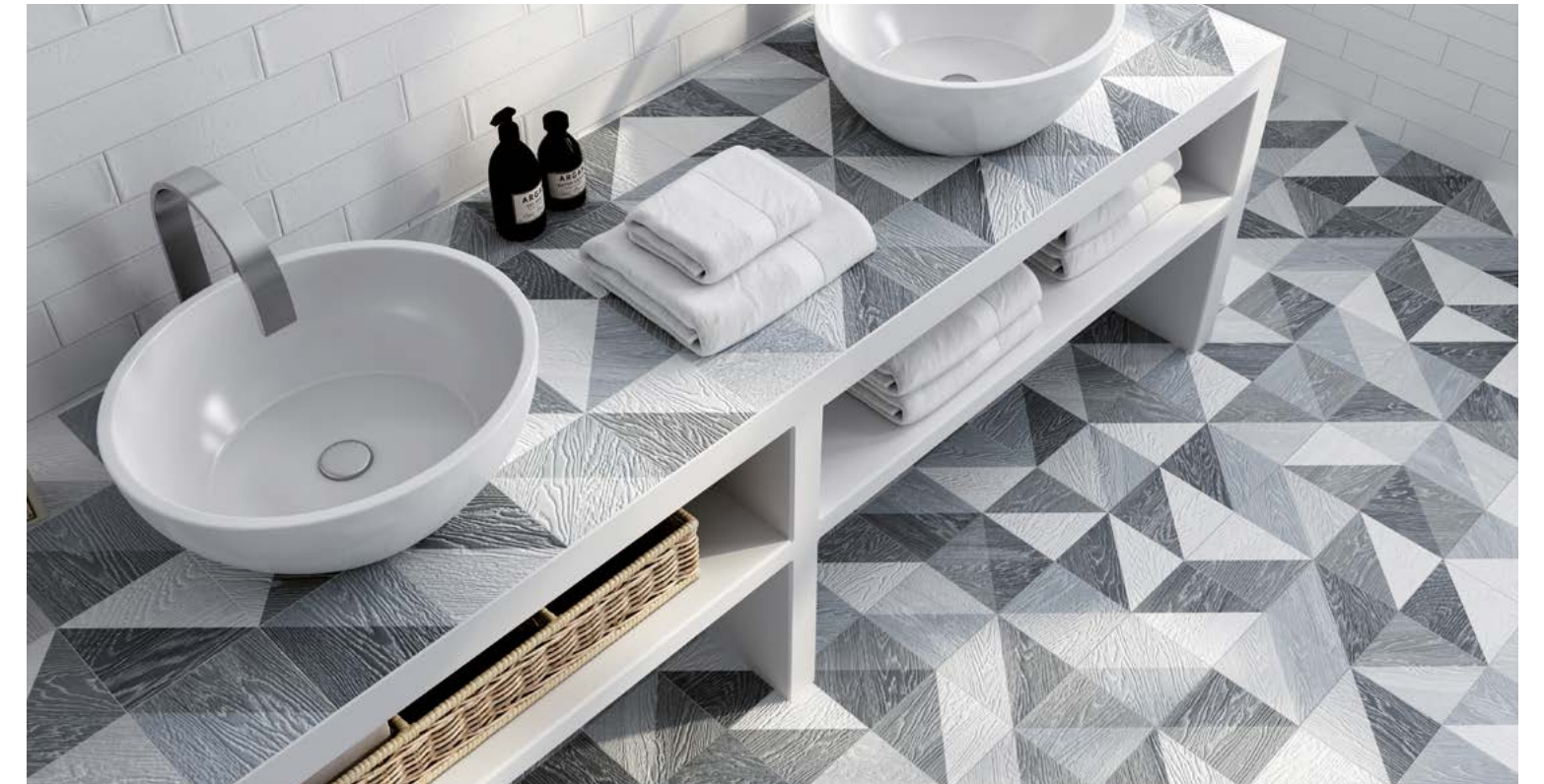
Taco Melange Black 16,5x16,5 / 6,5"x6,5" · Brick White 11x33,1,5 / 4,3"x13,1"