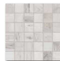
DDM06745 (SET) PEI 5 ○ 72 / set mat | matt