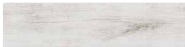
DAK82745 PEI 5 ○ 84 / m 2 mat | matt