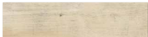
DAK82746 PEI 4 ○ 84 / m 2 mat | matt