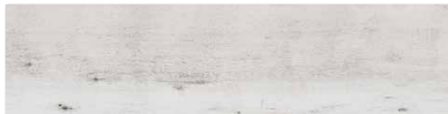
DAKVF745 PEI 5 ○ 90 / m 2 mat | matt