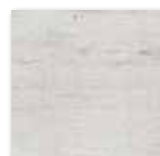
DAK26745 PEI 5 ○ 86 / m 2 mat | matt

bilo-šedá / white-grey / biato-szara бело-серый / blanco-gris