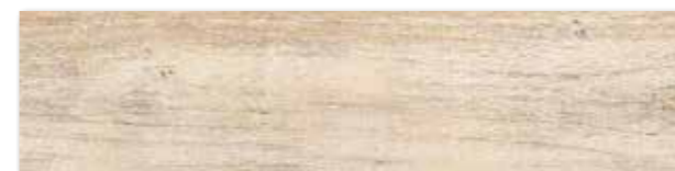
DAK82747 PEI 4 ○ 84 / m 2 mat | matt