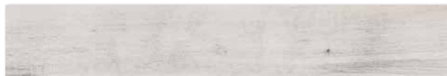
DAKVG745 PEI 5 ○ 90 / m 2 mat | matt