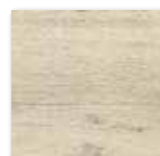
DAK26746 PEI 4 ○ 86 / m 2 mat | matt

běžová / beige / beżowa / бежевый / beige