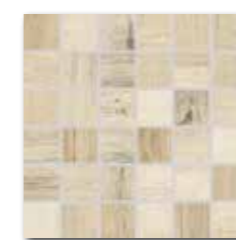
DDM06746 (SET) PEI 4 ○ 72 / set mat | matt