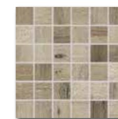
DDM06748 (SET) PEI 4 ○ 72 / set mat | matt