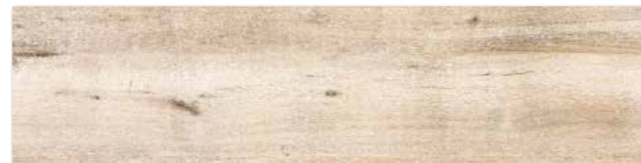
DAKVF747 PEI 4 ○ 90 / m 2 mat | matt