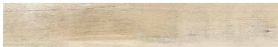
DAKVG746 PEI 4 ○ 90 / m 2 mat | matt