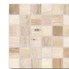
DDM06747 (SET) PEI 4 ○ 72 / set mat | matt