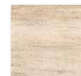
DAK26747 PEI 4 ○ 86 / m 2 mat | matt

světle hnědá / light brown / jasnobrązowa светло-коричневый / marrón claro