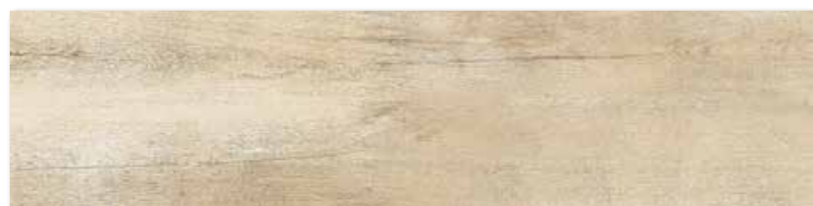
DAKVF746 PEI 4 ○ 90 / m 2 mat | matt