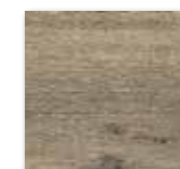
DAK26748 PEI 4 ○ 86 / m 2 mat | matt

tmavě hnědá / dark brown / ciemnobrązowa / темно-коричневый / marrón oscuro