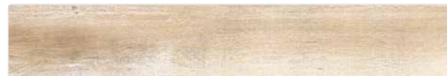
DAKVG747 PEI 4 ○ 90 / m 2 mat | matt