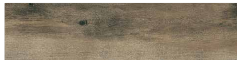
DAKVF748 PEI 4 ○ 90 / m 2 mat | matt