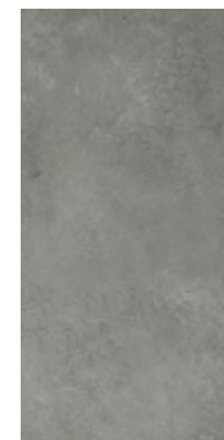
CRF 14 29,7x59,7 cm natura R10