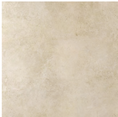
CRF 03 60x60, 59,7x59,7 cm natura R10