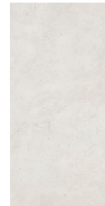
CRF 12 29,7x59,7 cm natura R10