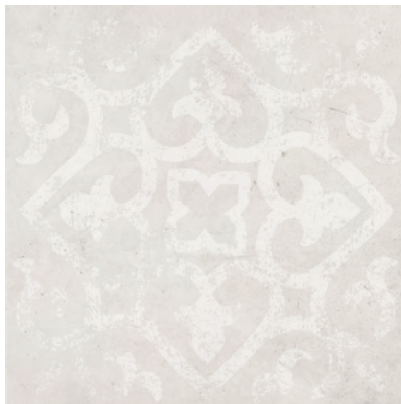
Dekor L-LDN-CRF 12 60x60 cm Dekor L-LDK-CRF 12 59,7x59,7 cm