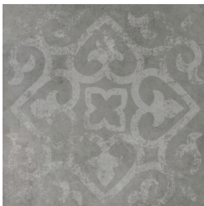
Dekor L-LDN-CRF 14 60x60 cm Dekor L-LDK-CRF 14 59,7x59,7 cm