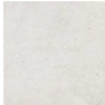
CRF 12 60x60, 59,7x59,7 cm natura R10