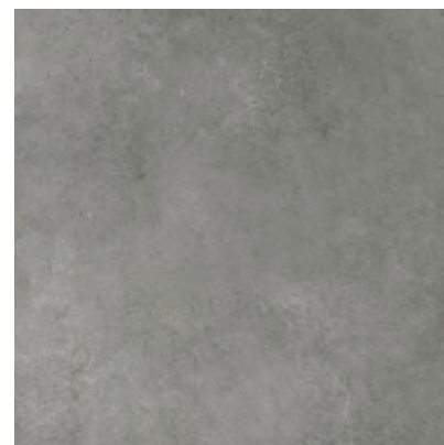
CRF 14 60x60, 59,7x59,7 cm natura R10