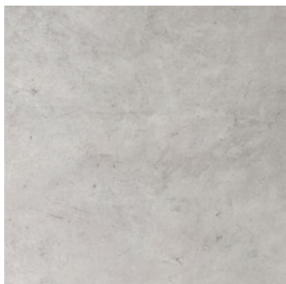
CRF 13 60x60, 59,7x59,7 cm natura R10