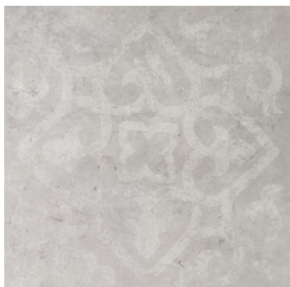
Dekor L-LDN-CRF 13 60x60 cm Dekor L-LDK-CRF 13 59,7x59,7 cm