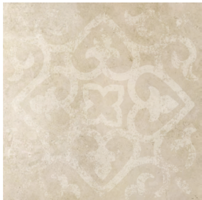
Dekor L-LDN-CRF 03 60x60 cm Dekor L-LDK-CRF 03 59,7x59,7 cm