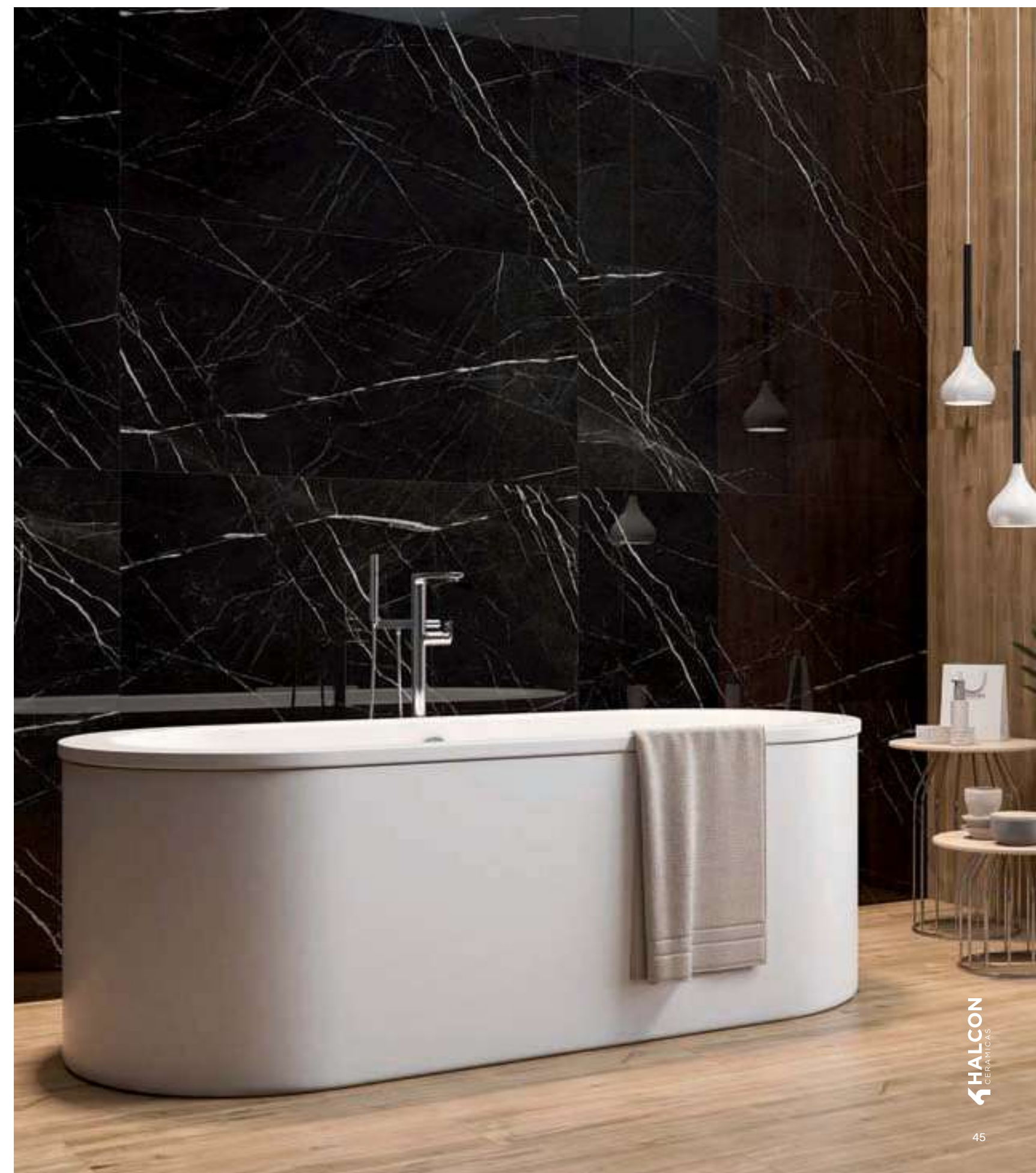
REVESTIMIENTO: KYRIAN BLACK PULIDO 60x120 cm RECT.