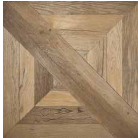
Arcade 75x75/30"x30" R