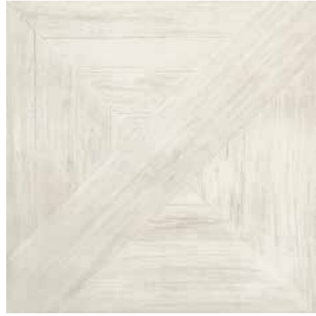
Lounge 75x75/30"x30" R