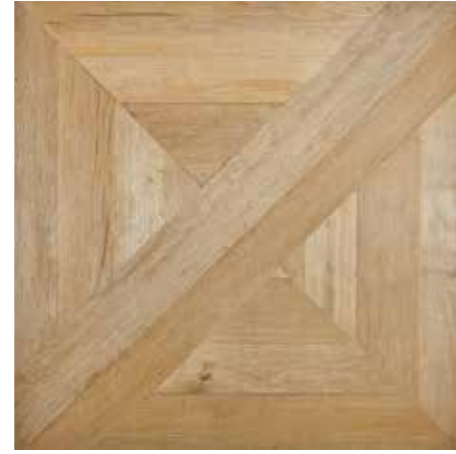
Hall 75x75/30"x30" R