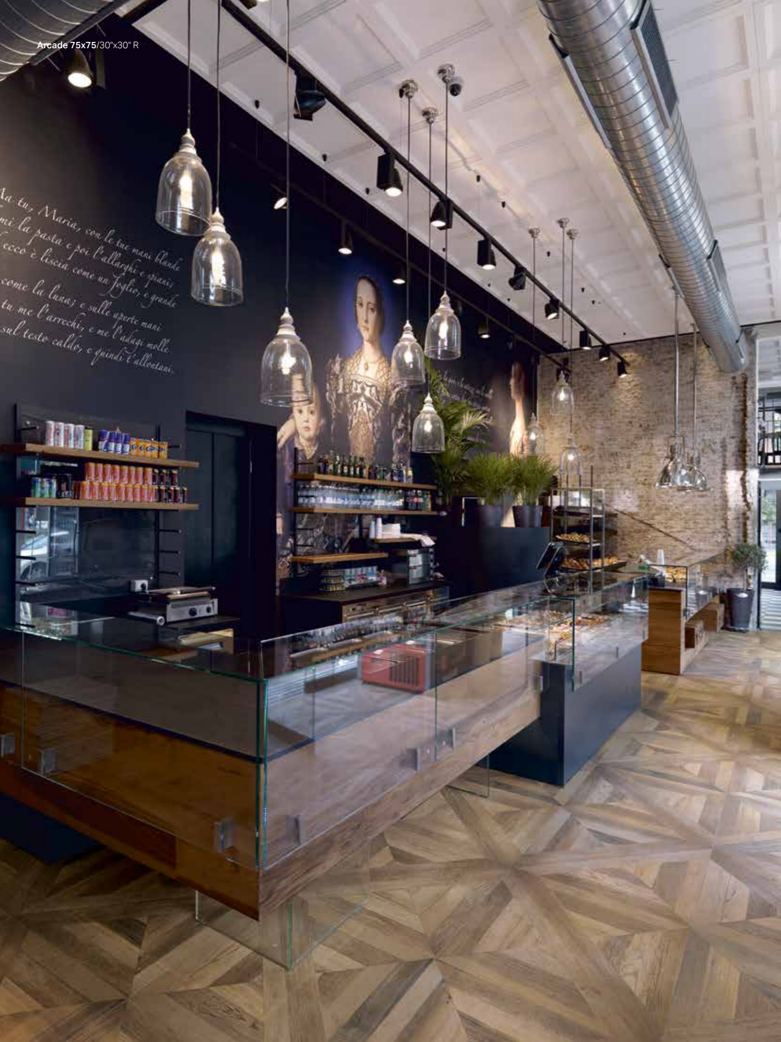
Arcade 75x75/30"x30" R