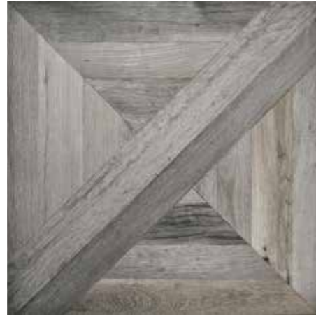
Court 75x75/30"x30" R