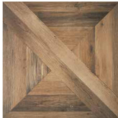
Library 75x75/30"x30" R