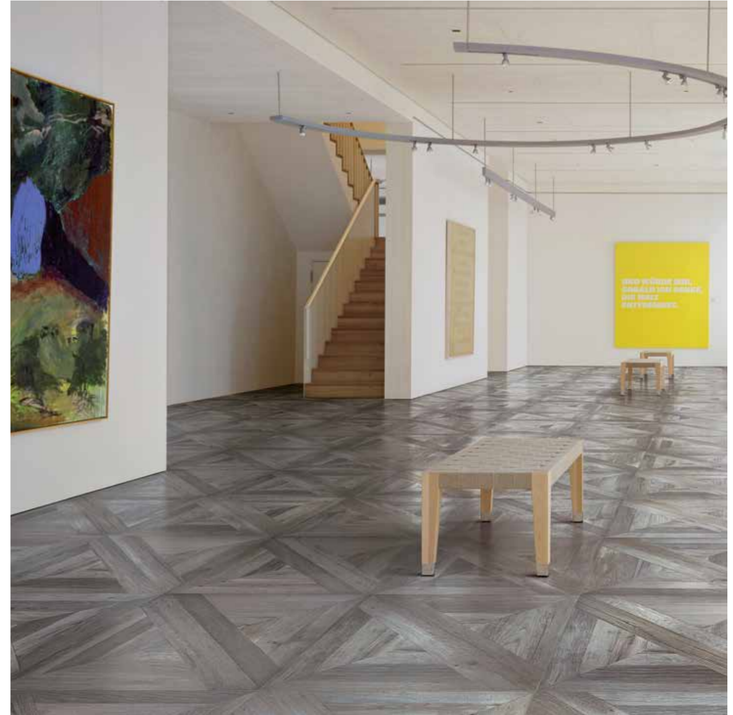
Court 75x75/30"x30" R