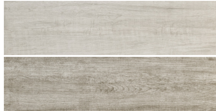
Clifton Ash 24x95 - G2510