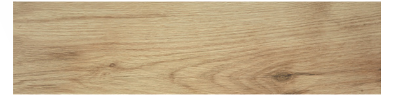
Olsen Natural 24x95 - G2510