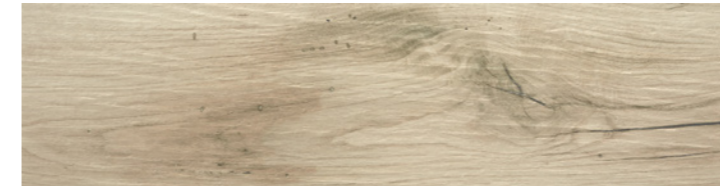
Olsen Beige 24x95 - G2510