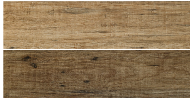
Clifton Brown 24x95 - G2523