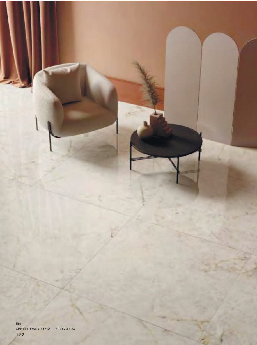
floor SENSI GEMS CRYSTAL 120x120 LUX 172