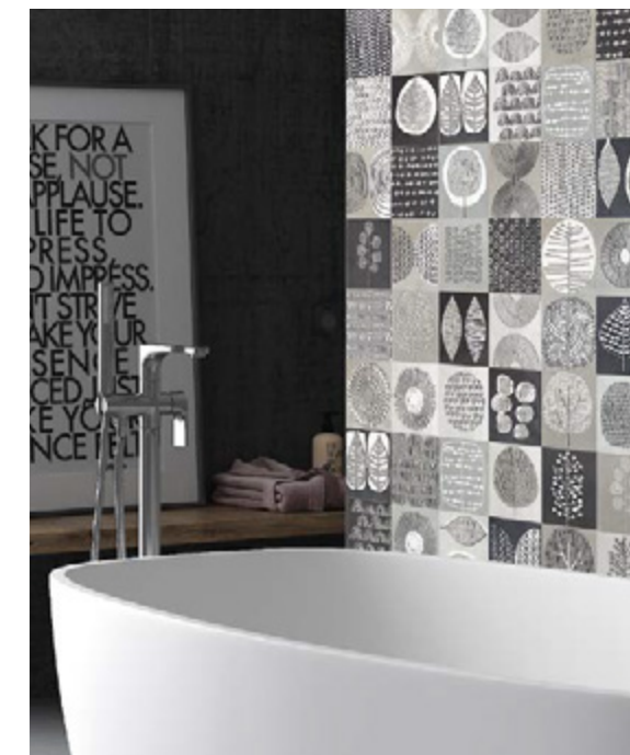
Taco Nairobi Gris 16,5x16,5 / 6,5"x6,5"