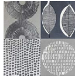
Nairobi Gris GF-20300D 33,15x33,15 / 13,1"x13,1"