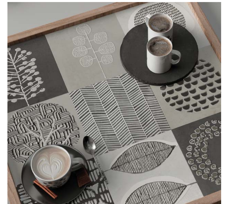
Taco Nairobi Gris 16,5x16,5 / 6,5"x6,5"