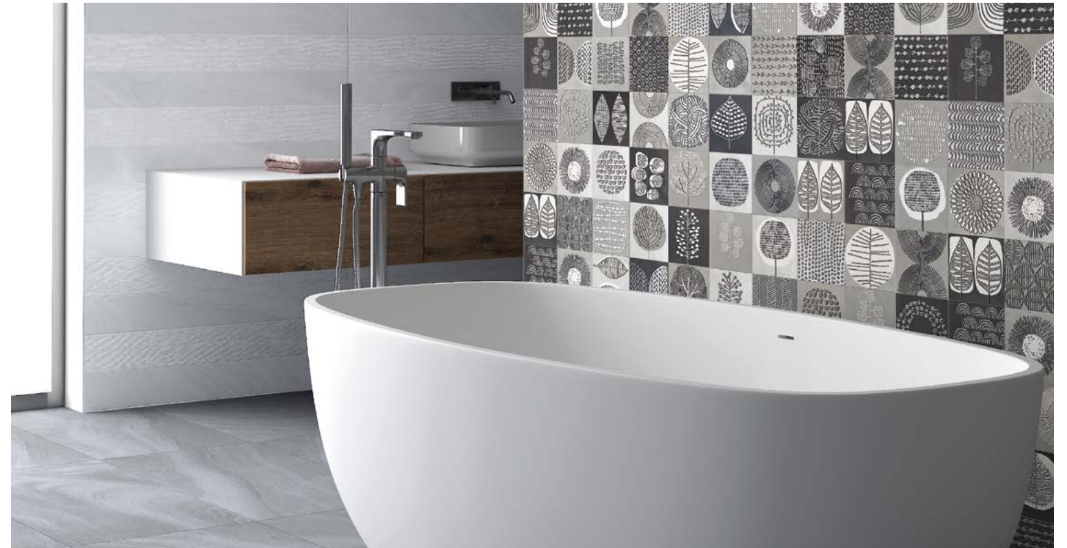
Taco Nairobi Gris 16,5x16,5 / 6,5"x6,5" - Deco Austral Blanco 45x90 / 17,7"x35,5" - Austral Gris 45x90 / 17,7"x35,5"