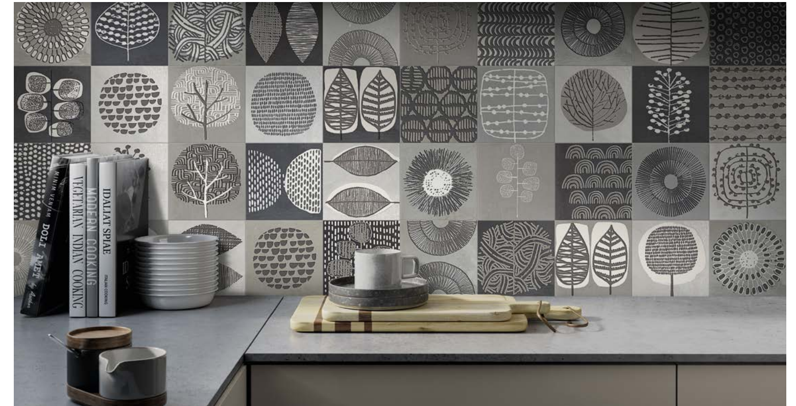
Taco Nairobi Gris 16,5x16,5 / 6,5"x6,5"