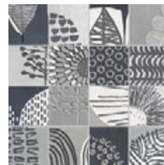
Mosaico GF-20045 Nairobi Gris 30x30 / 11,8"x11,8"