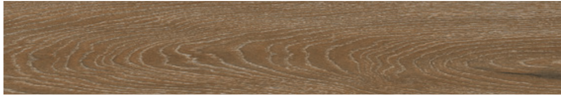
SHERWOOD NUT NEWARK NUT