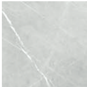
BEATRIS light grey 42 × 42