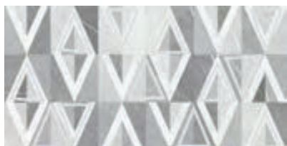
BEATRIS inserto geo 29,7 × 60