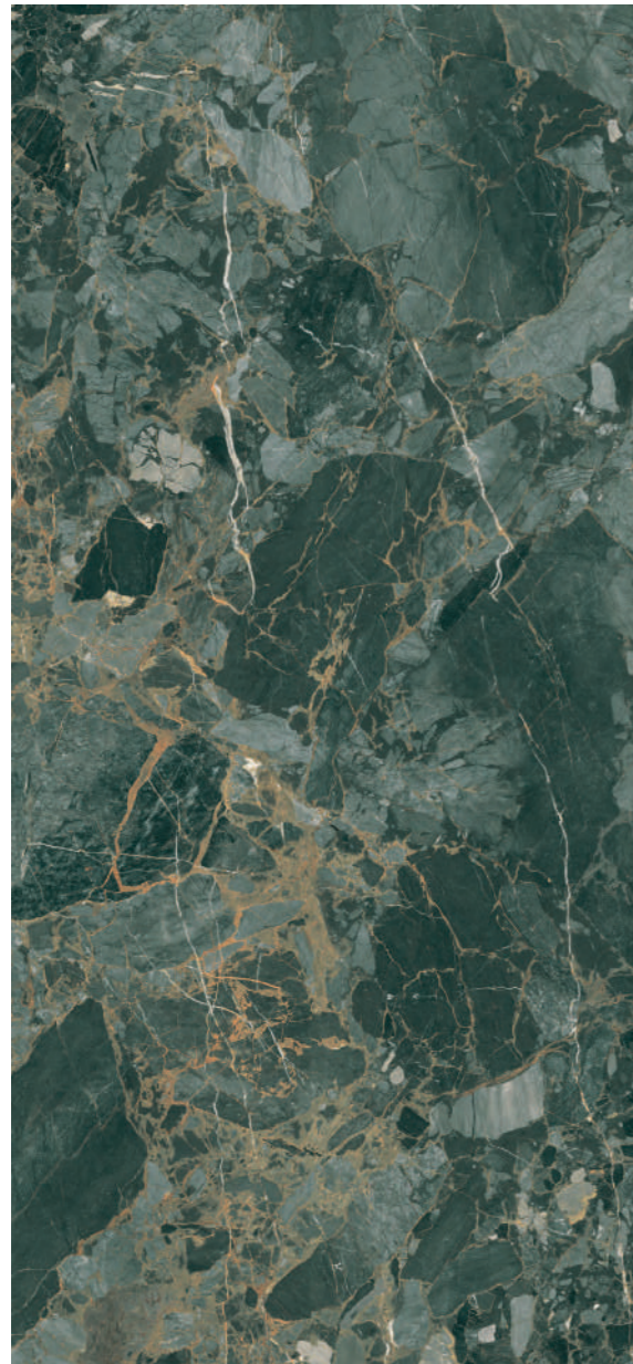
Indi Green Pulido 260 x 120 cm. XL2612RP