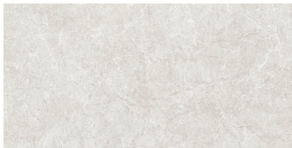
PIATRA SILVER P8016L