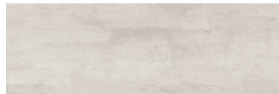
spectre grey 25x75 rektyfikowana 5902627434129