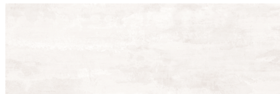
spectre white 25x75 rektyfikowana 5902627434112