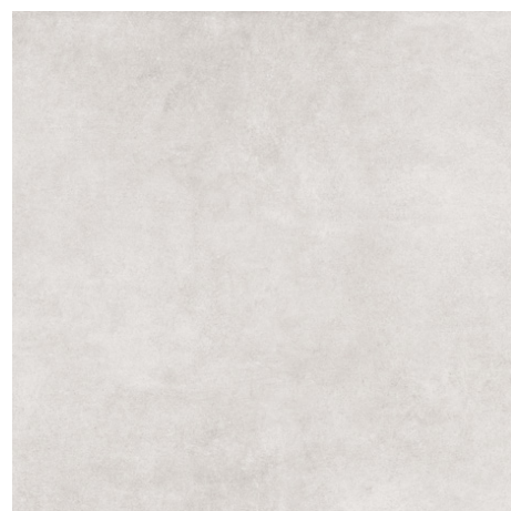
universal soft grey 60x60 rektyfikowana 5901503204917