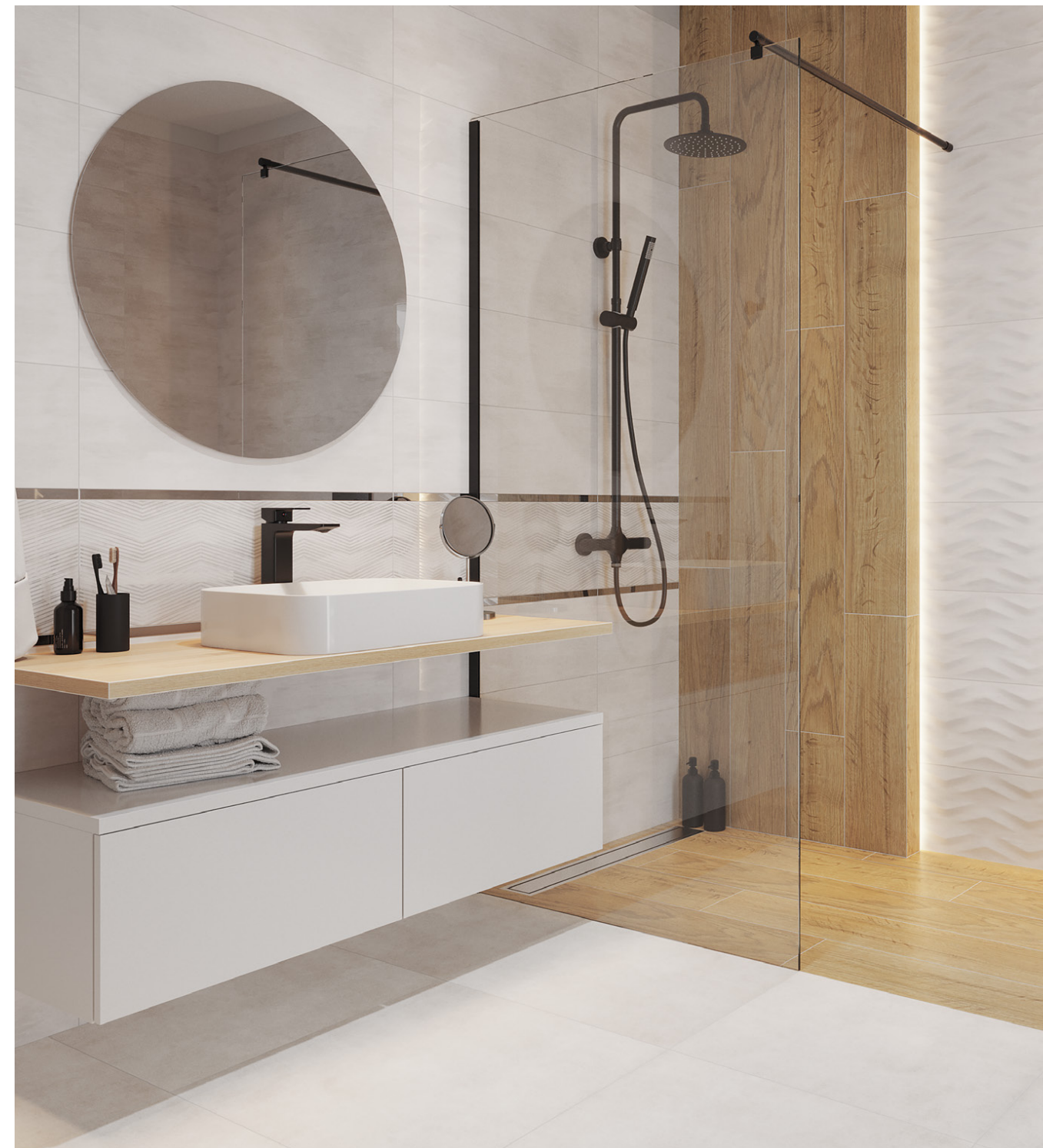
spectre 25x75 /rektyfikowana/