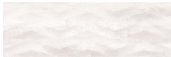
spectre white axis 25x75 rektyfikowana 5902627434136