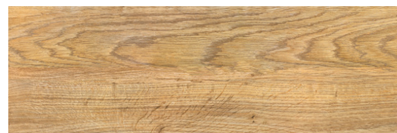
wood essence natural 25x75 rektyfikowana 5902627433399