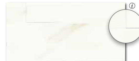
WARV4730* WARVK730** ○ 84 | m 2 mat | matt