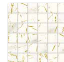
WDM06731* WDM05731** ○ 84 | set mat | matt