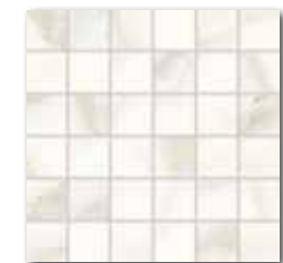
DDM06830 PEI 5 ○ 72 | set mat | matt | R10 | B