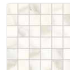
WDM06730* WDM05730** ○ 66 | set mat | matt