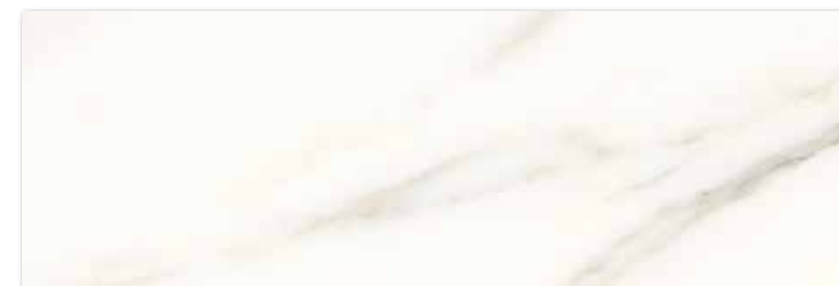
WAKV6730 ○ 90 | m 2 mat | matt