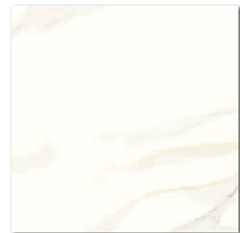
DAK63830 PEI 5 ○ 84 | m 2 mat | matt | R9 | A