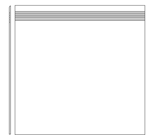
DCP63830 PEI 5 ○ 76 | ks mat | matt | R9 | A