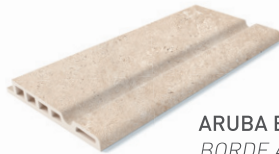
ARUBA EDGE BORDE ARUBA 25x50x3.4