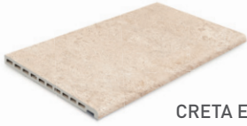
CRETA EDGE BORDE CRETA 33x50x2.5