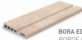
BORA EDGE BORDE BORA 20x50x3.4