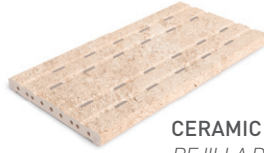
CERAMIC DRAIN GRATE REJILLA DE DRENAJE CERÁMICA RJ25 0000 25x50x2.2