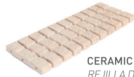
CERAMIC DRAIN GRATE REJILLA DE DRENAJE CERÁMICA RJ20 FLEX 20x50x2.2

ANTISHOCK Worldwide Patent Patente Mundial