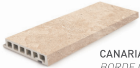
CANARIAS EDGE BORDE CANARIAS 18x50x3.4