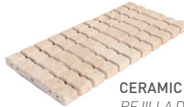
CERAMIC DRAIN GRATE REJILLA DE DRENAJE CERÁMICA RJ25 FLEX 25x50x2.2

ANTISHOCK Worldwide Patent Patente Mundial