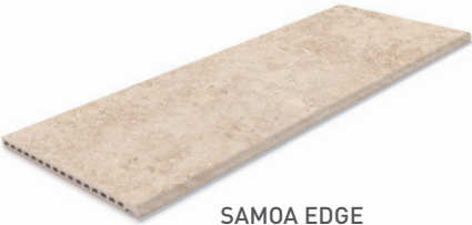
SAMOA EDGE BORDE SAMOA 50x120x2.5