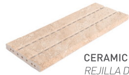
CERAMIC DRAIN GRATE REJILLA DE DRENAJE CERÁMICA RJ20 0000 20x50x2.2

ANTISHOCK Worldwide Patent Patente Mundial