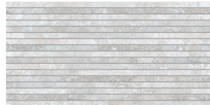
S0000618 TOSCANO METRIC 60X120 LIGHT DIGITAL SOFT