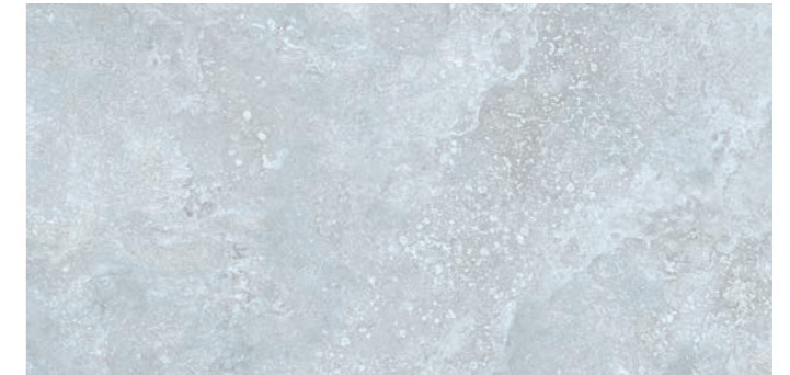
S0000617 TOSCANO 60X120 GREY DIGITAL SOFT