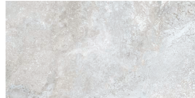
S0000616 TOSCANO 60X120 LIGHT DIGITAL SOFT