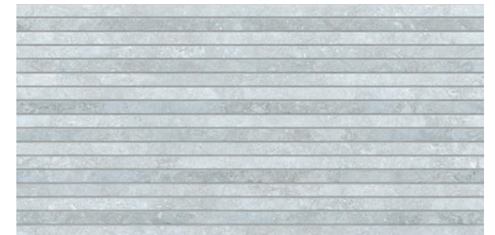
S0000619 TOSCANO METRIC 60X120 GREY DIGITAL SOFT