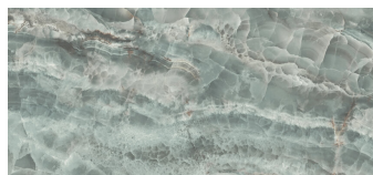
SAPHIRE JADE PULIDO XL2612GRP