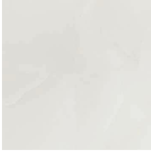
ONIX BLANCO 75 X 75 / 30" X 30" REC. \square 75 X 75 / 30" X 30" REC. NPLUS