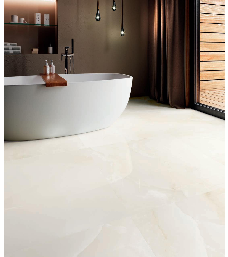
FLOOR TILE — PAVIMENTO ONIX BLANCO 90 X 90 REC. NIPLUS