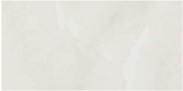
ONIX BLANCO 45 X 90 / 18" X 36" REC. \square 45 X 90 / 18" X 36" REC. NPLUS