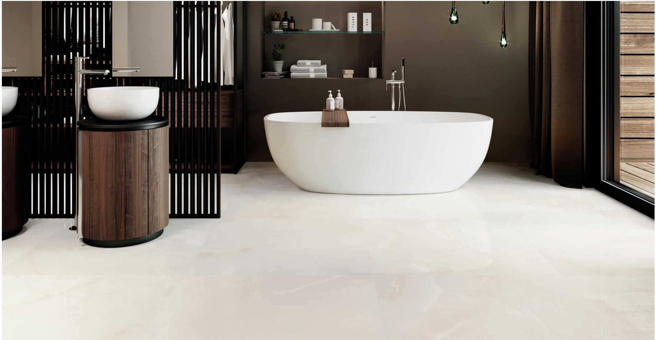
FLOOR TILE — PAVIMENTO ONIX BLANCO 90 X 90 REC. NPLUS