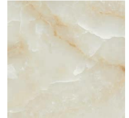
ONIX BEIGE 60 X 60 / 24" X 24" REC. F 60 X 60 / 24" X 24" REC. NPLUS