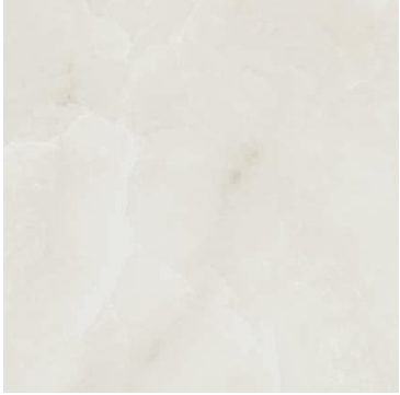
ONIX BLANCO 90 X 90 / 36" X 36" REC. \square 90 X 90 / 36" X 36" REC. NPLUS