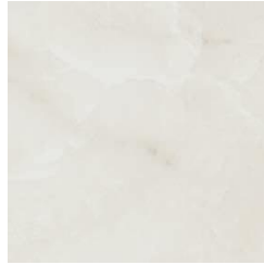
ONIX BLANCO 60 X 60 / 24" X 24" REC. \square 60 X 60 / 24" X 24" REC. NPLUS