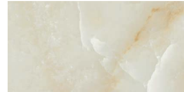
ONIX BEIGE 45 X 90 / 18" X 36" REC. F 45 X 90 / 18" X 36" REC. NPLUS