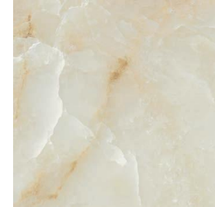
ONIX BEIGE 75 X 75 / 30" X 30" REC. F 75 X 75 / 30" X 30" REC. NPLUS