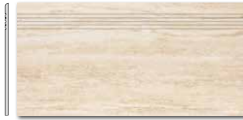
DCPSE731 PEI 5 ○ 72 / ks mat | matt