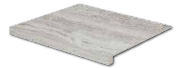
DCF65733* PEI 4 ○ 94 / ks mat | matt | R10 | A šedá / grey / szara / серый / gris