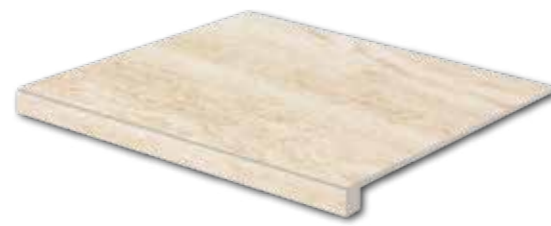
DCF65731* PEI 5 ○ 94 / ks mat | matt | R10 | A béžová / beige / bežowa / бежевый / beige