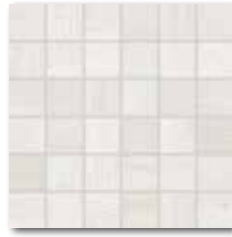
DDM06730 (SET) PEI 5 ○ 72 / set mat/lappato | matt/lappato