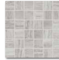
DDM06733 (SET) PEI 4 ○ 72 / set mat/lappato | matt/lappato