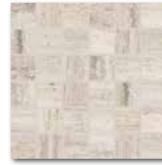
DDM06732 (SET) PEI 5 ○ 72 / set mat/lappato | matt/lappato