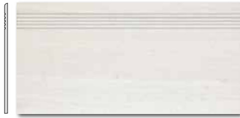
DCPSE730 PEI 5 ○ 72 / ks mat | matt