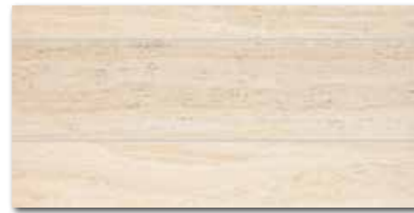
DDPSE731 (SET) PEI 5 ○ 68 / set mat/lappato | matt/lappato