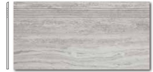
DCPSE733 PEI 4 ○ 72 / ks mat | matt