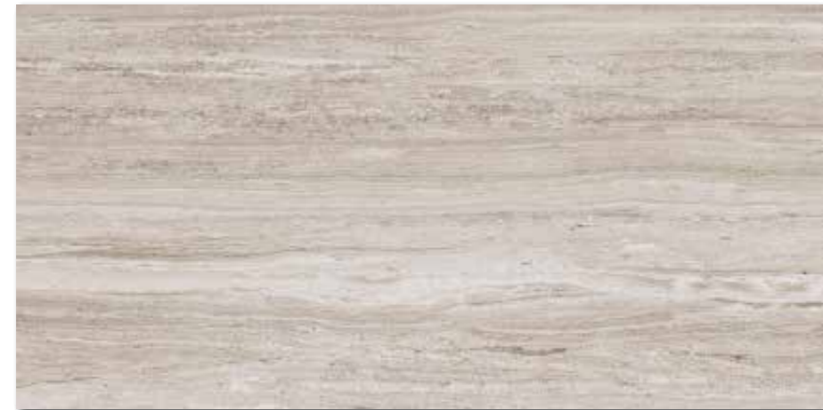
DARV1732 PEI 5 \odot 94 / m 2 mat | matt | R10 | A

hnědo-šedá / brown-grey / brązowoszara / коричневый-серый / gris-marrón