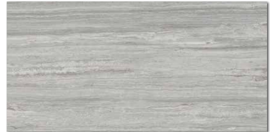
DARV1733 PEI 4 \odot 94 / m 2 mat | matt | R10 | A