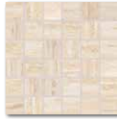
DDM06731 (SET) PEI 5 ○ 72 / set mat/lappato | matt/lappato