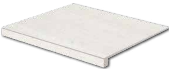
DCF65730* PEI 5 ○ 94 / ks mat | matt | R10 | A stonová kost / ivory / kość stonowa / слоновая кость / marfil