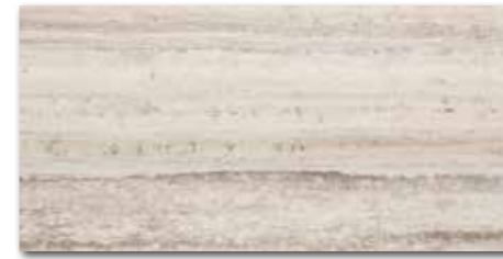
DDPSE732 (SET) PEI 5 ○ 68 / set mat/lappato | matt/lappato