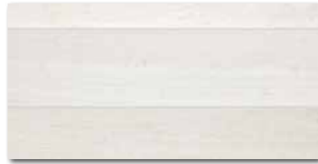
DDPSE730 (SET) PEI 5 ○ 68 / set mat/lappato | matt/lappato