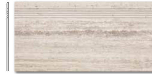
DCPSE732 PEI 5 ○ 72 / ks mat | matt