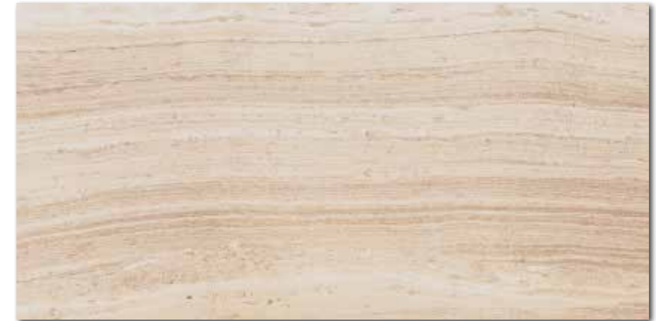
DARV1731 PEI 5 \odot 94 / m 2 mat | matt | R10 | A

běžová / beige / beżowa / бежевый / beige