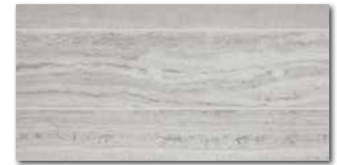
DDPSE733 (SET) PEI 4 ○ 68 / set mat/lappato | matt/lappato