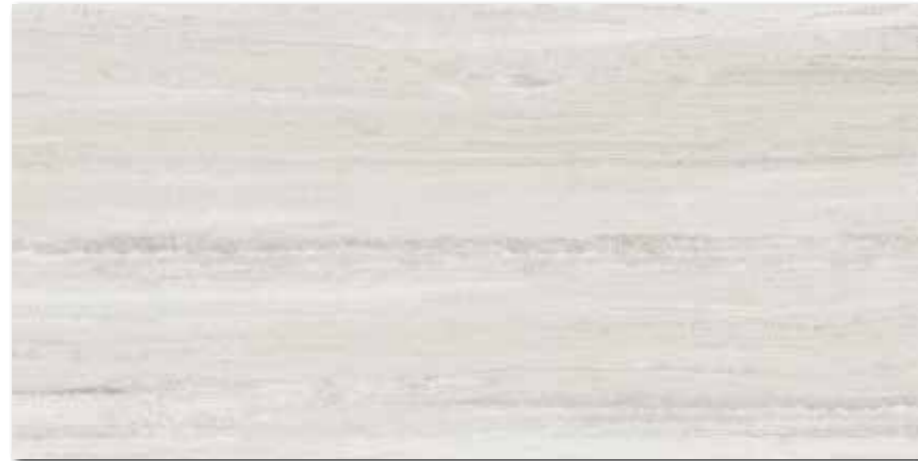
DARV1730 PEI 5 \odot 94 / m 2 mat | matt | R10 | A

slonová kost / ivory / kość słoniowa / слонобая кость / marfil