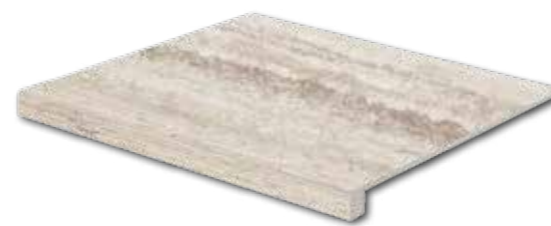
DCF65732* PEI 5 ○ 94 / ks mat | matt | R10 | A hnědo-šedá / brown-grey / brązowoszara / коричневый-серый / gris-marrón