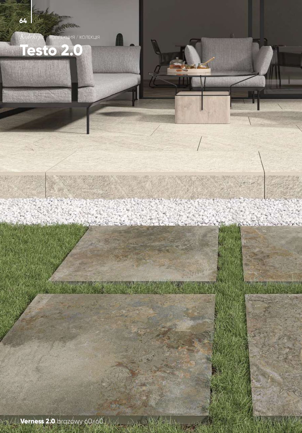
Verness 2.0 brązowy 60×60