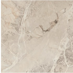
ELEGANCE MARFIL 75 X 75 / 30" X 30" REC. F 75 X 75 / 30" X 30" REC. NPLUS N7A1 N7C1