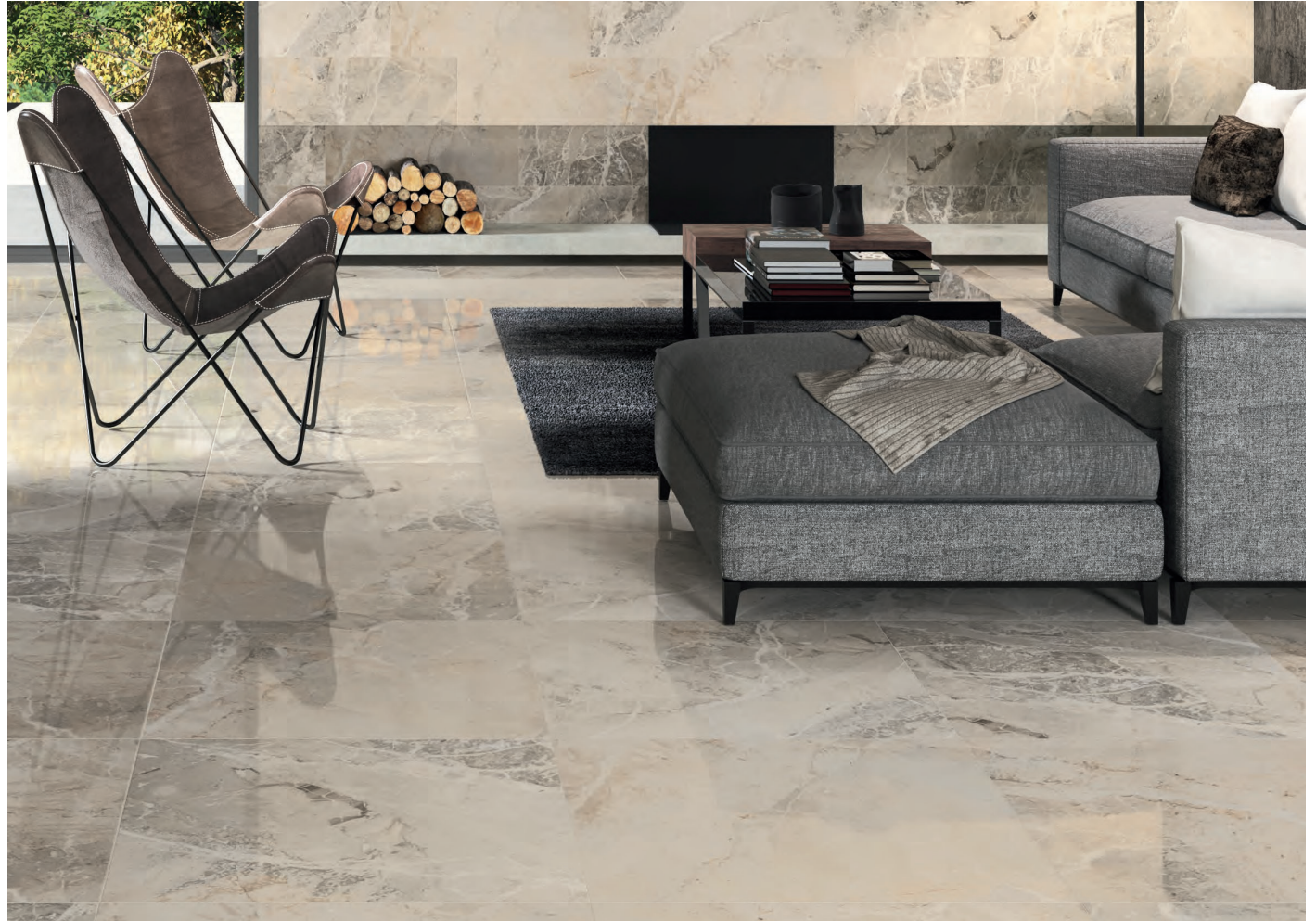
Floor Tile / Pavimento ELEGANCE MARFIL 75 X 75 REC. NPLUS