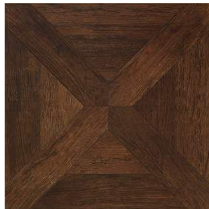
224012/165021 VINTAGE ROVERE RETT 478x478x8