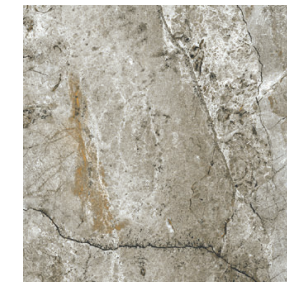
MARBLE SKIN grey matt / 59,8 × 59,8 NT1058-034-1