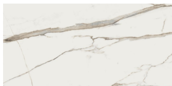
MARMARA GOLD NATURAL P6012L