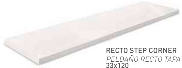
RECTO STEP CORNER PELDAÑO RECTO TAPA 33x120