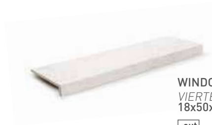
WINDOW SILL VIERTEGUAS 18x50x3.2