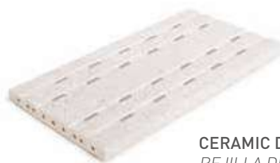
CERAMIC DRAIN GRATE REJILLA DE DRENAJE CERÁMICA RJ25 0000 25x50x2.2