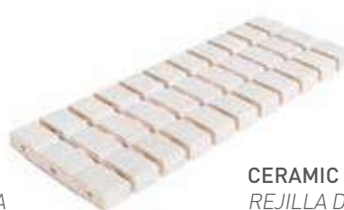
CERAMIC FLEX DRAIN GRATE REJILLA DE DRENAJE CERÁMICA FLEX RJ20 FLEX 20x50x2.2