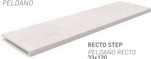
RECTO STEP PELDAÑO RECTO 33x120