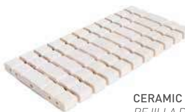
CERAMIC FLEX DRAIN GRATE REJILLA DE DRENAJE CERÁMICA FLEX RJ25 FLEX 25x50x2.2