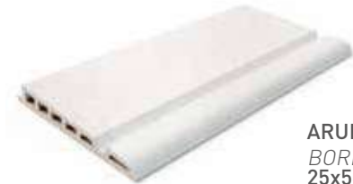
ARUBA EDGE BORDE ARUBA 25x50x3.4