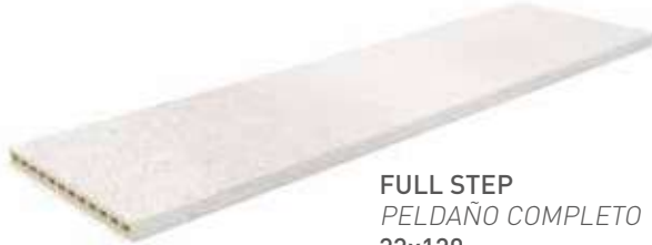
FULL STEP PELDAÑO COMPLETO 33x120