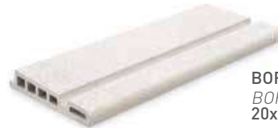
BORA EDGE BORDE BORA 20x50x3.4