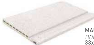
MAUI EDGE BORDE MAUI 33x50x2.5