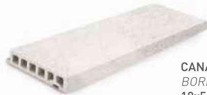
CANARIAS SUPPORT EDGE BORDE SOPORTE CANARIAS 18x50x3.4