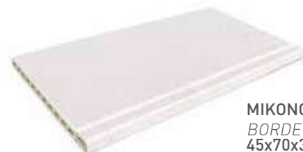
MIKONOS EDGE BORDE MIKONOS 45x70x3/3.5