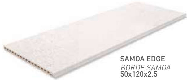
SAMOA EDGE BORDE SAMOA 50x120x2.5