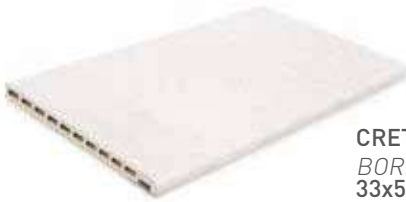
CRETA EDGE BORDE CRETA 33x50x2.5