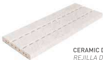
CERAMIC DRAIN GRATE REJILLA DE DRENAJE CERÁMICA RJ20 0000 20x50x2.2