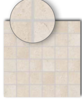
DDM06801 (SHEET) PEI 5 ○ 440 | Netz matte/lappato beige | beige