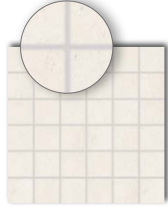
DDM06800 (SHEET) PEI 5 ○ 440 | Netz matte/lappato elfenbein | ivory