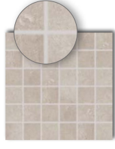
DDM06802 (SHEET) PEI 4 ○ 440 | Netz matte/lappato beige-grau | beige-grey